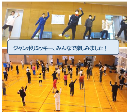
ジャンボリミッキー、みんなで楽しみました！