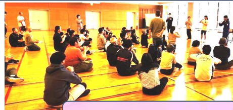
手話ソング『世界に一つだけの花』