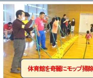
体育館を奇麗にモップ掃除！