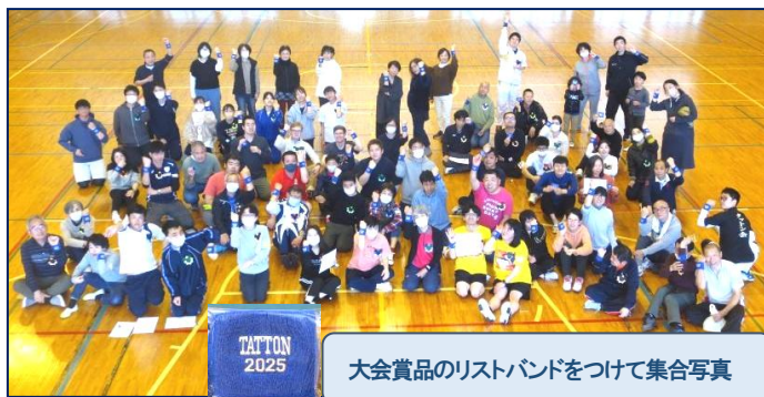
大会賞品のリストバンドをつけて集合写真