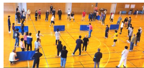
卓球チーム・バドミントンチームに分かれてドッチビー