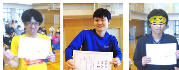
三位 114回Taさん 二位 157回Toさん 一位 174回Nさん