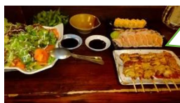
追浜一丁目食堂 鳥刺しやお子様 ランチなど…

この新年会を心から楽しみにしていたのが息子(チャレンジャー)。居酒屋に行かれる、顔馴染みの心温かい皆様とおしゃべりができると、この日はグループホームからの朝の足取りも軽いようでした。