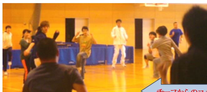
チーフからのコメント

11月29日は、139回目のタットン会。朝からぼつぼつ〜帰るときには、大粒の雨が・・・(皆様大丈夫でしたでしょうか!?)。